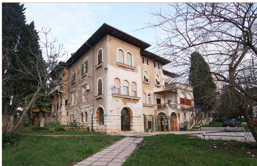
Villa Trapp danas

Trapp-Villa in Pula heute