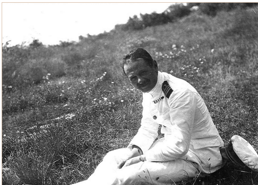
Poručnik bojnog broda Georg Ritter von Trapp 1915. godine u Puli (SKPU) Linienschiffsleutnant Georg v. Trapp im J. 1915 in Pola (SKPU)