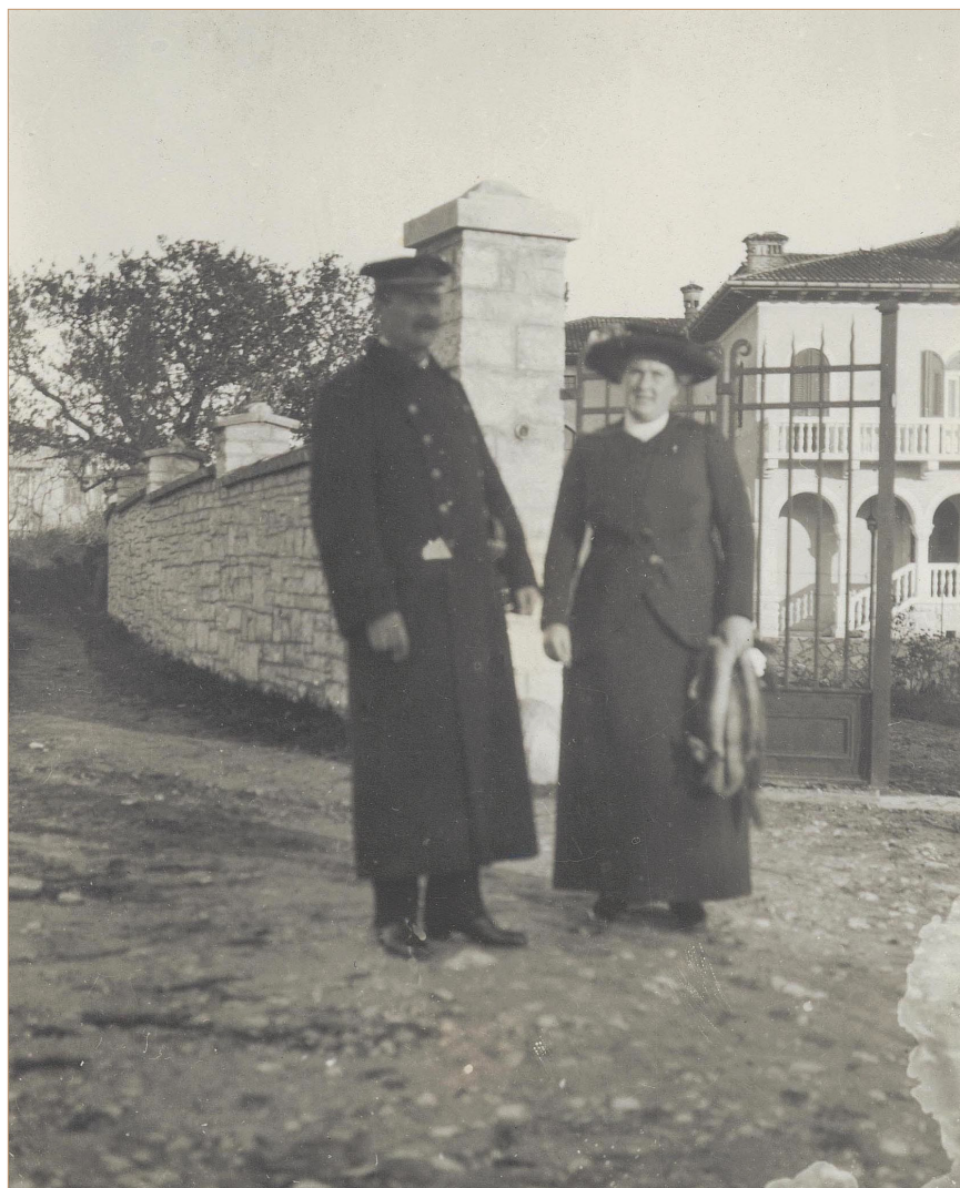
Georg v. Trapp sa suprugom Agathom, u pozadini je Villa Trapp (1915.) (SKPU) Georg v. Trapp mit seiner Frau Agathe, im Hintergrund die Trapp-Villa, 1915 (SKPU)

matischen Zara (heute Zadar) geboren, zog es Georg (Zara/Dalmatien/, 4. April 1880 – Stowe, Vermont /USA/, 30. Mai 1947) bereits als Vierzehnjährigen zur Marine. Nach Absolvierung der Marineakademie erhielt der Seekadett sein erstes größeres Bordkommando (Korvette Saida , Ostasien-Australien-Reise), dann auf einem Panzerkreuzer und nahm an den Kämpfen während des