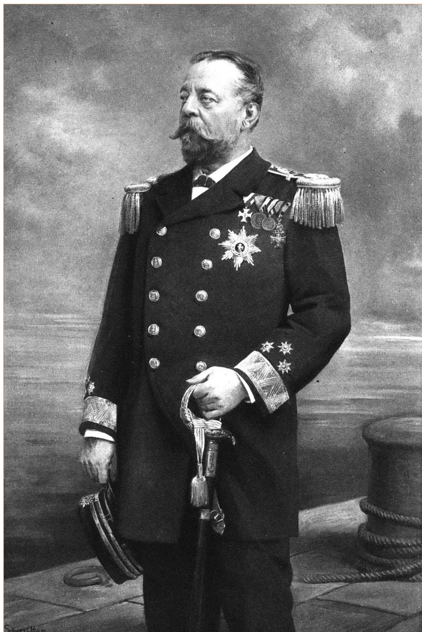
Sterneck u admiralskoj uniformi (SKPU) Sterneck im Uniform der Admiral (SKPU)