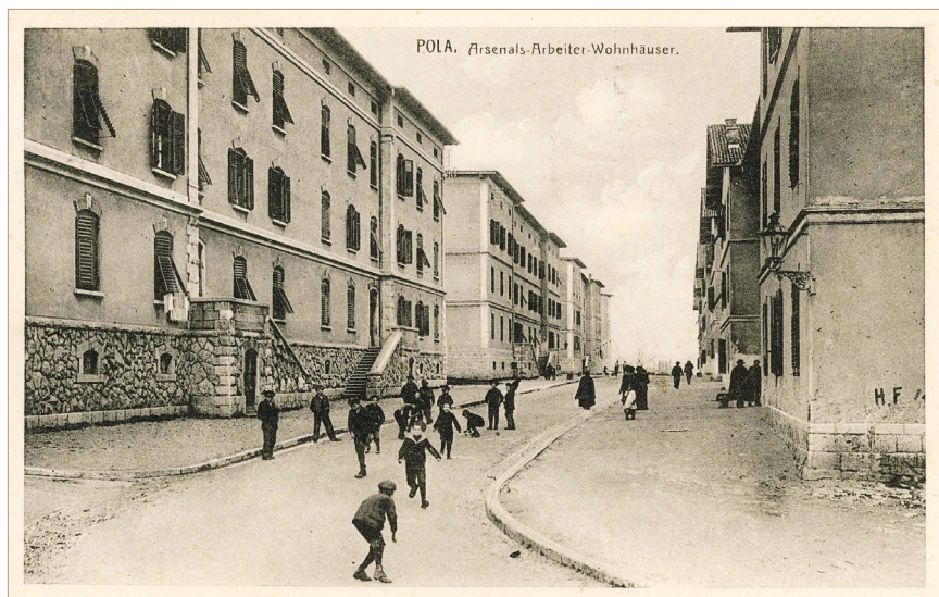
Stambene zgrade za obitelji radnika u Arsenalu (tzv. Barake) u nekadašnjoj ulici Via Sterneck, oko 1910.; snimio A. Beer (D.W.) Wohnhäuser der Arsenalarbeiter (sogennanten Baracchen) im ehemaligen Via Sterneck in Pola, um 1910; Foto A. Beer (D.W.)