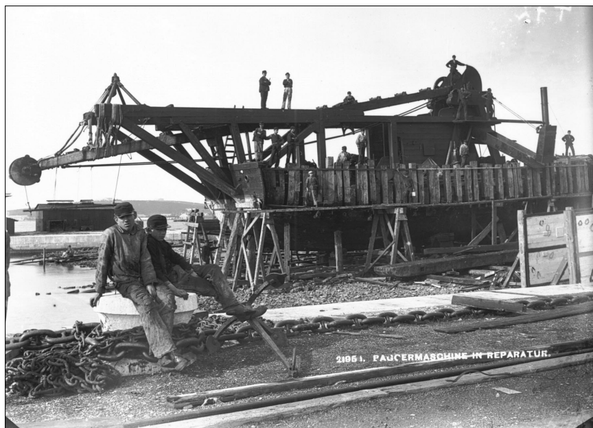
Radnici u Arsenalu Die Arbeiter im Arsenal

sernen in Verwendung. Das Fort, in dem ich untergebracht war, lag der Stadt am nächsten, das heißt, die rasch sich entwickelnde Stadt war den Hügel zu ihm emporgekommen, doch lagerte noch ein ansehnlicher Gürtel Weideland herum, der uns als Exerzierplatz diente. Meine Soldaten brauchten nur aus den kühlen, steinernen Kasematten hervor- und über die Zugbrücke hinauszutreten und standen bereits auf ihrem Übungsfeld. Auch ein Gemüsegärtchen war angelegt worden, mit einem Hühnerstall, es schwebte fast etwas Gemütliches, bürgerlich Zusammengehörendes um die kleine, in manchem sich grenzten Sonnigkeit wies sie, das Wort mag einigermaßen verwundern, fast etwas sanatoriumsmäßiges auf, was nicht ohne Bedeutung für uns war, denn die Stadt wurde gerade damals von einem bösen schleichenden Fieber heimgesucht, das man nicht leicht wieder aus den Knochen bekam.