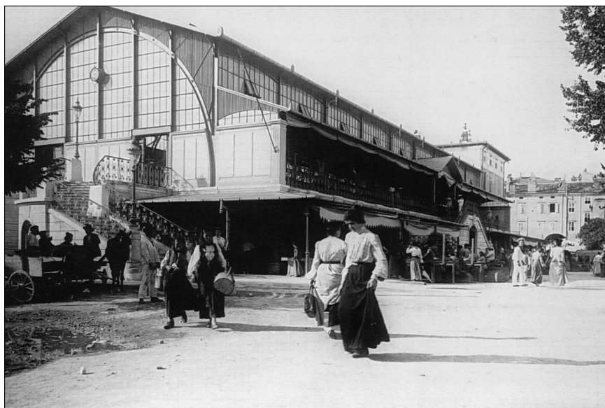
Žene ispred zgrade tržnice, oko 1910., snimio A. Beer (D. W.) Die Frauen vor der Markthalle, um 1910, Foto A. Beer (D. W.)

puno nedovoljnih utvrđenja iz doba otaca, najviše ih je bilo porušeno; samo nekoliko upotrebljavalo se još kao skladišta ili vojarne. Tvrđava kojoj ja bijah dodijeljen ležala je najbliže gradu, što znači da se grad koji se brzo razvijao popeo preko brežuljka k njoj. Ipak, oko nje bijaše još priličan pojas pustopolja, koje je služilo kao vježbalište. Moji vojnici trebali su samo iz prohladnih, kamenih kazamata izaći van preko pokretnog mosta i već su bili na svom vježbalištu. Također bijaše tu i mali povrtnjak s kokošinjcem. Bilo je gotovo nešto udobno, pučko, u maloj koloniji koja se mnogočime sama opskrbljivala. Zbog svojega položaja na uzvisini i bezgranične sunčanosti, činila se, riječ može u neku ruku čuditi, gotovo poput lječilišta, što ne bijaše bez značenja za nas, jer u gradu je baš tada vladala epidemija neke zle groznice, koje se nije moglo lako riješiti. Iz opreza bilo je naređeno u puku da se vojnicima svako jutro podijeli čašica kinina.“