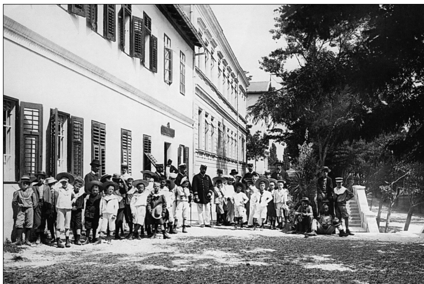
Mornarička škola u Puli Marineschule in Pola

zabavno pričale talijanski, glasno i nevjerojatno brzo: iz posuda su izlazili oštri mirisi octa, svježega bijelog kiselog kruha i crnog istarskog vina – sasvim drukčiji mirisi od onih što su se širili od jela na našim uredno pripremljenim stolovima. One su se često gurale prilično bezobzirno između dotjeranih majka i njihove djece, između odgajateljica djece i crno-zlatnih odora časnika, jer se njima žurilo. Kad je buknuo podnevni pucanj s tvrđave Kaštel, one su morale biti na arsenalskoj kapiji. Tada bi jedan čovjek u službenoj odori, s dugom, smeđom razdijeljenom bradom otvorio kapiju, pa bi nastao živahan metež, dok je svaka žena među nahrupjelim radnicima pronašla onoga pravoga i uručila mu njegov ručak. Neki od tih muškaraca posjedali su na stepenice velikih vanjskih stupa koje su vodile od arsenalske ceste gore k “Prednjem vojničkom vježbalištu” i tamo su jeli. Stidljivo sam gledala muškarce koji su tako jadni i nisu smjeli primiti svoj ručak u kakvoj sobi. Ali žene su morale odmah žurno istim putem natrag. One su bile strane, neshvatljivo strane, izgledale su kao da ne vole otmjene majke s bebama.“