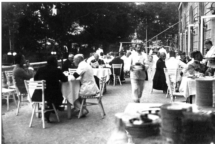
Mornarički časnici na terasi Mornaričkog kasina u Prvom svjetskom ratu (D. W.) Marineoffiziere auf die Terrasse des Marinekasinos im Ersten Weltkrieg (D. W.)

mehr um heilsame Verständigung als um das Behagen am Kampf an sich. Zudem war ja der österreichische Offizier von jeder politischen Betrachtung ausgeschaltet, und es gehört wirklich zu einer der merkwürdigsten seelischen Erscheinungen, daß diese Forderung fast ausnahmslos wie etwas im Grunde Selbstverständliches befolgt wurde, und zwar nicht nur, weil es solcher gewiß ins Dauernde verbucht zu werden verdient. Es war im Kreise österreichischer Offiziere so gut wie unmöglich, daß ein Kamerad um seiner andersartigen völkischen Wesenheit willen, und sei sie noch so deutlich gefärbt gewesen, angegriffen oder zurückgesetzt worden wäre. Kam es hin und wieder zu kleineren Neckereien, wurden sie liebenswürdig gebracht und liebenswürdig hingenommen und erfüllten so den tieferen Sinn jener menschlichen Verständigung in der Höflichkeit des Herzens, ohne die sich auf Erden kein dauerndes Haus bauen läßt.