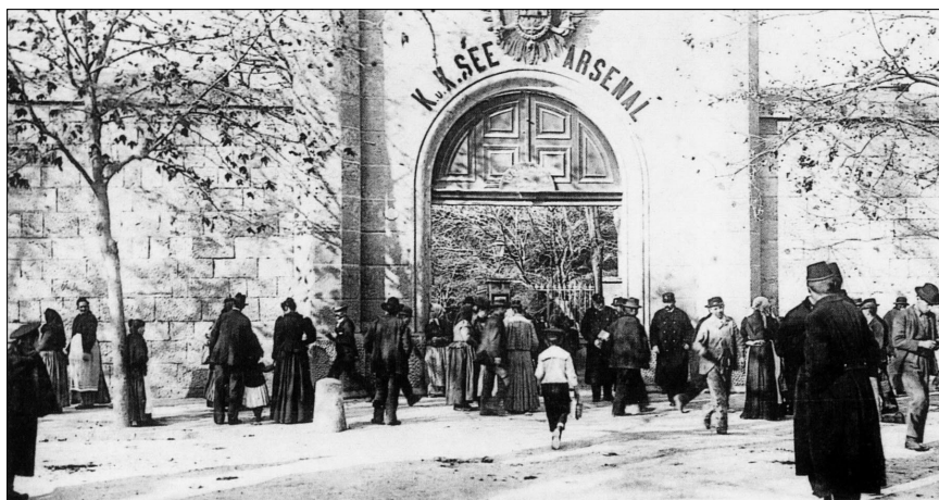
Ulaz u Arsenal, snimio A. Beer (D. W.) Das Eingangstor des Arsenal, Foto A. Beer (D. W.)

se korvetu možemo pouzdati. Ona je na koncu plovila niz vjetar, što znači potpuno bez jedara i pokazala se i za to sposobna. Kad je mogla odoljeti na svojem divnom trogodišnjem jedrenju oko svijeta najoštrijim tajfunima i ciklonima Indijskog oceana, onda je pak sve ovo sadašnje bilo samo dječja igra.”