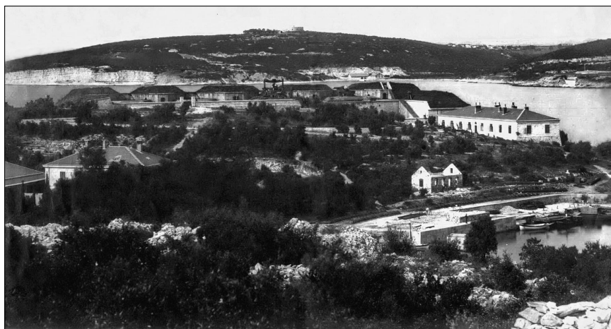
Obalna bitnica Fisella Batterie Fisella

fröhlich farbigen Venezianer oder Triestiner canzonetten einstellten, bis dann zuletzt die Slowenen ihre so völlig anders gearteten wehmütig gedehnten Gesänge erschallen ließen, die sich dem Marschschritt allerdings nicht immer flüssig gesellten. Und dann begannen die Deutschösterreicher von neuem und dann die andern wieder, sie fanden sich in gutem Einverständnis leicht und froh zusammen, es war, als reichte immer ein Volk dem andern im Wettgesang seine Lieder dar, auf daß in dieser klingend versöhnlichen Welt keine Mißverständnisse mehr bestünden. Der Einklang, der sich daraus ergab, er legte sich auch versöhnlich auf den Zwiespalt in meiner eigenen Brust, und es konnte sich im weiteren ereignen, daß auch die wehmütige karstische Landschaft, die wir durchschritten, sich trotz ihrer Armut und Dürftigkeit plötzlich den Liedern farbig tönend gesellte und daß sie mir dann als ein durchaus Wesenhaftes und keineswegs Bedeuchtungsloses erschien.